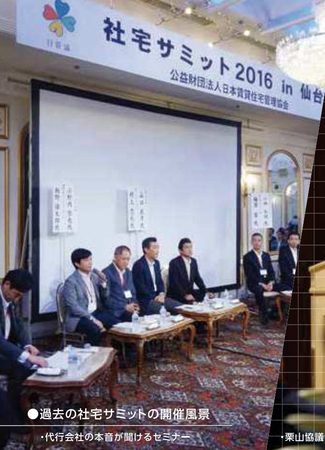
●過去の社宅サミットの開催風景