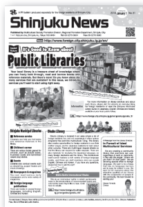
外国語広報紙しんじゅくニュース