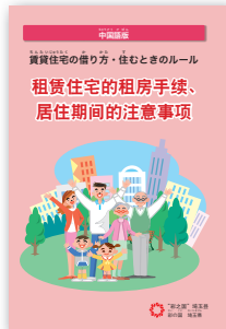
「賃貸住宅の借り方・住むときのルール」